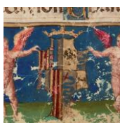
Orazioni ad uso di Isabella d'Aragona Manoscritto in pergamena, 1511-1518 Miniatura di scuola napoletana Milano, Archivio Storico Civico e Biblioteca Trivulziana, Cod. Triv. 2144, ff. 8v-9r