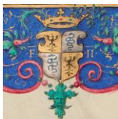
Evangelistario ad uso di Francesco II Sforza Manoscritto in pergamena, 1531-1533 Miniatura di scuola lombarda, attribuita a Giovanni Giacomo Decio Milano, Archivio Storico Civico e Biblioteca Trivulziana, Cod. Triv. 2148, ff. 62v-63r