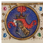
Costantino Lascaris, Erotemata

La grammatica greca del Lascaris ebbe diverse redazioni manoscritte nel corso degli anni, finché l'opera fu fissata nella stampa a Milano, nel 1476, da Dionigi Parravicino. L'edizione del Parravicino, qui esposta nella terza vetrina accanto al codice Trivulziano 2147, è il primo libro impresso in Italia interamente in greco, ad eccezione della prefazione in latino. Rispetto al manoscritto Trivulziano, tuttavia, questa edizione a stampa – anche se coeva o di poco precedente – presenta evidenti differenze testuali. A partire dall'edizione di Dionigi Parravicino, la grammatica greca del Lascaris conobbe un buon successo anche nella produzione a stampa, come documenta per esempio l'edizione veneziana di Aldo Manuzio recante nel colophon la data «anno ab incarnatione Domini nostri Iesu Christi M.CCCC.LXXXIII ultimo Februarii», anch'essa in mostra nella terza vetrina del percorso espositivo.